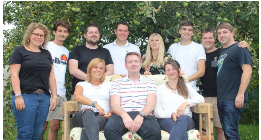
Mitwirkende der Theatergruppe der VSG

Die Theatergruppe freut sich, Sie wieder zahlreich im Schützenheim begrüßen zu dürfen, wenn es wieder heißt: „Vorhang auf, Theater Asbach-Bäumenheim!“