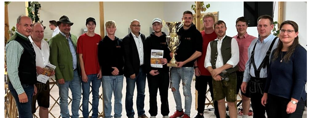
Die Sieger mit Sponsoren Paninka und Trabert

Aufgrund der vielen positiven Rückmeldungen steht einer Neuauflage des Bürgerschießens im nächsten Jahr nichts im Wege.